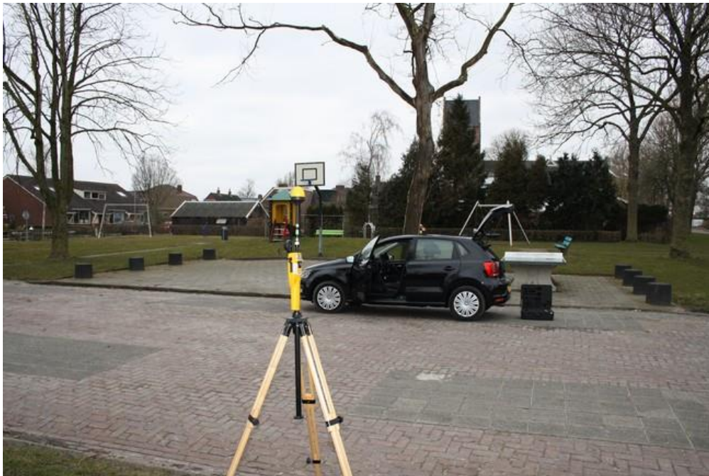
Foto 2: Opstelpunt breedbandige meting parkeerplaats Hofmastraat thv. Wilhelminastraat te Oldenhove.

De selectieve veldsterktemeting is op dezelfde locatie en op hetzelfde moment uitgevoerd als de breedbandige meting.