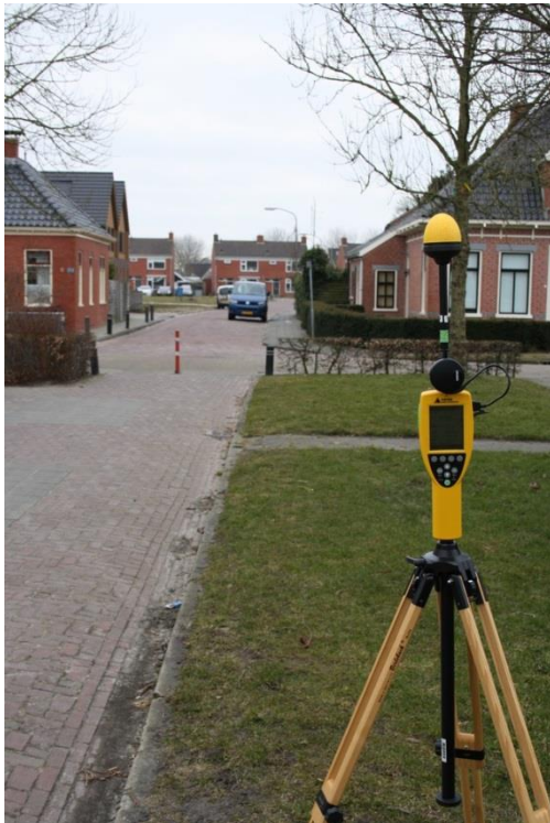
Foto 1: Opstellpunt breedbandige meting parkeerplaats Hofmastraat thv. Wilhelminastraat te Oldehove.

De breedbandige meting is gedaan door Toezicht Agentschap Telecom.