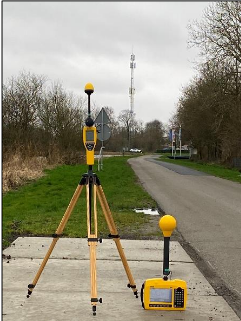
Figuur 1: Foto van de breedbandige outdoor meetopstelling

Op de foto hierboven (figuur 1) is de breedbandige outdoor meetopstelling te zien. Het meetapparaat staat aan de (openbare) aan de Duinigermeerweg in Blokzijl. Op de achtergrond staat de dichtstbijzijnde vast opgestelde antenne-installatie.