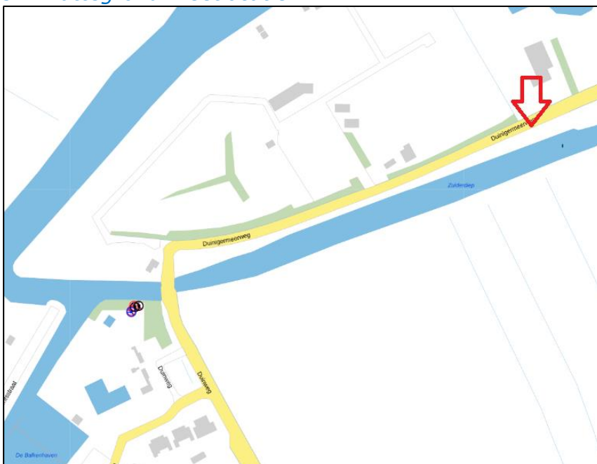
Figuur 2: Weergave van het Antenneregister