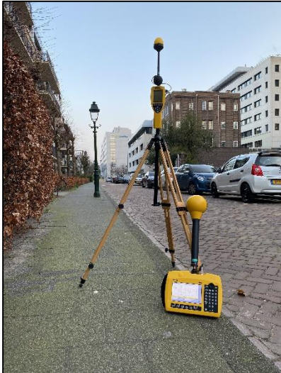
Figuur 1: Foto van de breedbandige outdoor meetopstelling

Op de foto hierboven (figuur 1) is de breedbandige outdoor meetopstelling te zien. Het meetapparaat staat aan de (openbare) weg aan de Koningin Sophiestraat in 's Gravenhage. Op de achtergrond staat een vast opgestelde antenne-installatie. De dichtstbijzijnde vast opgestelde antenne-installatie is niet zichtbaar op de foto.