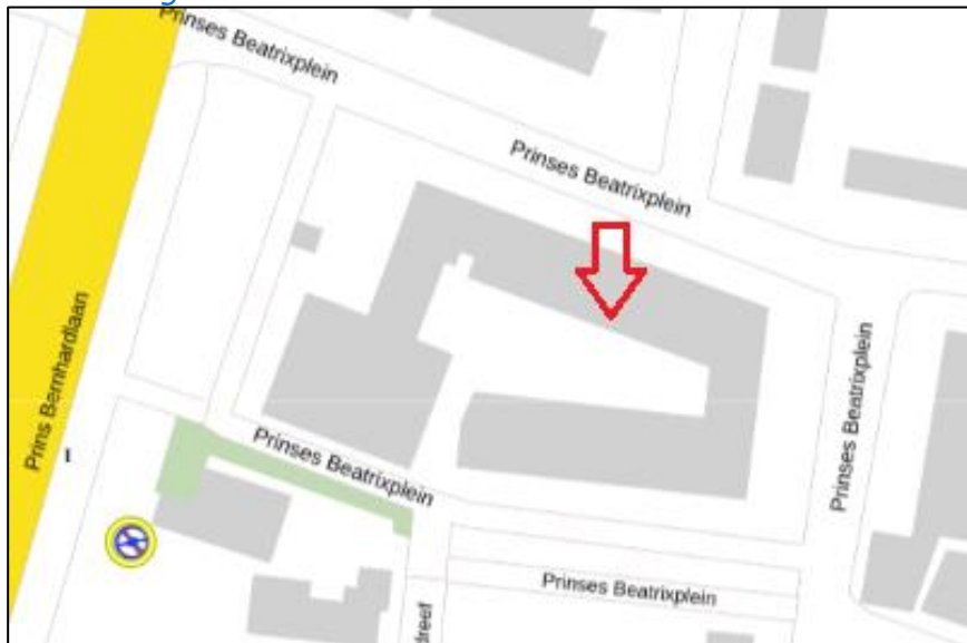
Figuur 3: Weergave van het Antenneregister