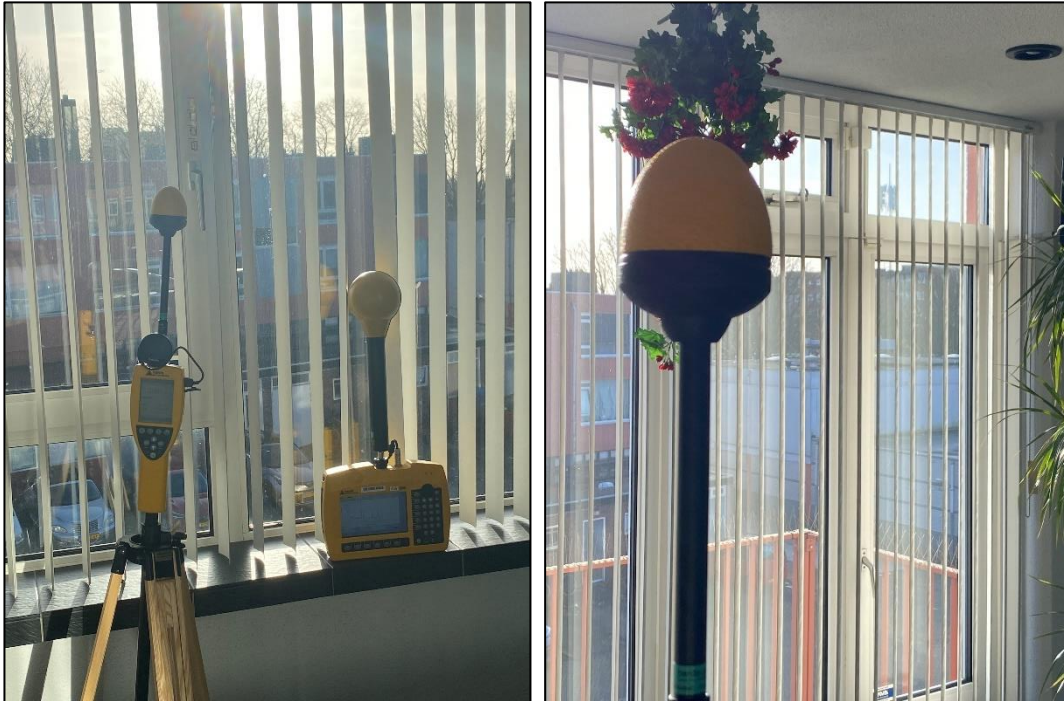
Figuur 1 en 2: Foto's van de breedbandige en selectieve indoor meetopstelling

Op de foto's hierboven (figuur 1 en 2) is de breedbandige en selectieve indoor meetopstelling te zien. Het meetapparaat staat opgesteld in de woonkamer. Op de achtergrond van de rechter foto staat de dichtstbijzijnde vast opgestelde antenne-installatie.