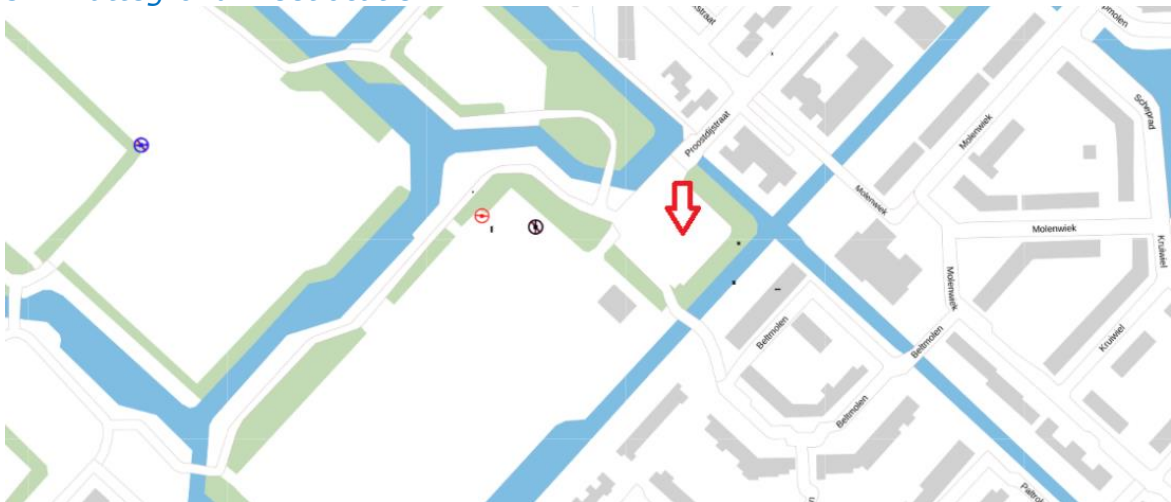
Figuur 2: Weergave van het Antenneregister

Bovenstaande afbeelding (figuur 2) is de weergave van het Antenneregister van de omgeving waar de EMV-meting heeft plaatsgevonden. In de weergave van het Antenneregister zijn een aantal gekleurde cirkels zichtbaar. Deze cirkels geven de opstelplaatsen van de verschillende antenne-installaties weer. Op de locatie met de zwarte, blauwe, bordeaux rode en paarse cirkels is 2G, 3G, 4G en 5G in gebruik. De rode cirkels zijn vaste verbindingen, ook wel point-to-point verbindingen genoemd.