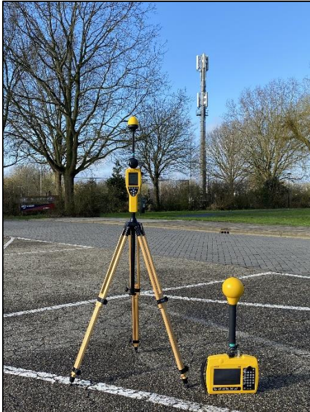
Figuur 1: Foto van de breedbandige outdoor meetopstelling

Op de foto hierboven (figuur 1) is de breedbandige outdoor meetopstelling te zien. Het meetapparaat staat op de parkeerplaats aan de Proostdijstraat in Mijdrecht. Op de achtergrond staat de dichtstbijzijnde vast opgestelde antenne-installatie.