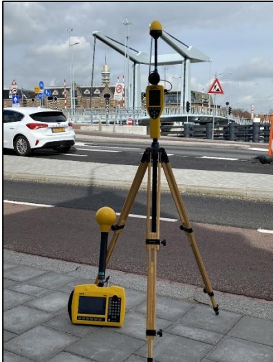
Figuur 1: Foto van de breedbandige outdoor meetopstelling

Op de foto hierboven (figuur 1) is de breedbandige outdoor meetopstelling te zien. Het meetapparaat staat aan de (openbare) weg aan de Zaanweg in Wormerveer. Op de achtergrond is een vast opgestelde antenne-installatie zichtbaar.