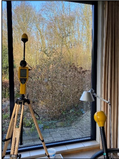
Figuur 1: Foto van de breedbandige indoor meetopstelling

Op de foto hierboven (figuur 1) is de breedbandige indoor meetopstelling te zien. Het meetapparaat staat opgesteld in de woonkamer. De dichtstbijzijnde vast opgestelde antenne-installatie (Gamerschedijk) is vanuit de meetlocatie niet te zien.